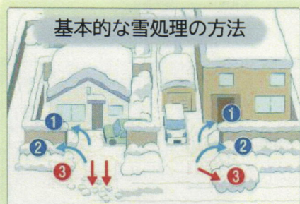
基本的な雪処理の方法

前日の夜に出されたごみは、除雪作業の妨げとなります。ごみが道路に散らばってしまうこともあります。